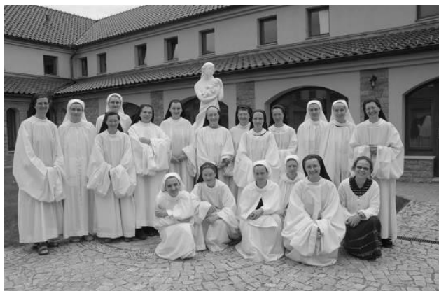
/Z knihy Blázni pro Boha vypsala Lada/

Způsob obživy: psaní ikon a současně kontemplace, výroba obrázků, výroba potravinářských a cukrářských produktů, zahrada a chov včel. V ČR žijí sestry trapistky v Poličanech - klášter naší Paní nad Vltavou.