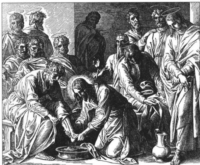
Ježíš myje apoštolům nohy. Grafický list z biblických ilustrací nazarenské školy.

Tématem večerní liturgie jsou dvě události: Ježíšova večeře, při níž ustanovuje tajemství eucharistie a myje apoštolům nohy; Ježíšova modlitba v Getsemanské zahradě a jeho zjetí.