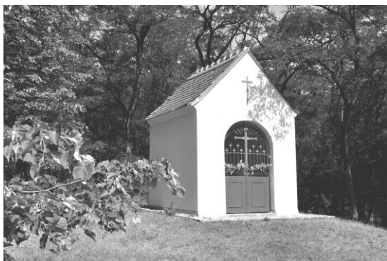
Foto: kaple sv. Peregrina