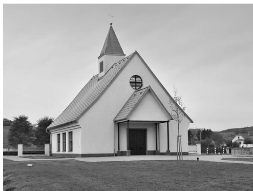
Foto: kaple v Pršticích