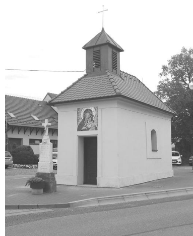
Foto: kaple v Popůvkách